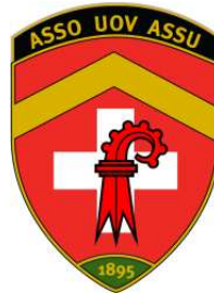
Aufkleber in Form des UOV-Badge: CHF 2.-- / Stk.