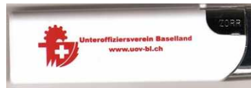
Feuerzeug (Nachfüllbar) mit UOV-Logo und Webadresse: CHF 1.-- / Stk.

Bestellungen sind schriftlich zu richten an: