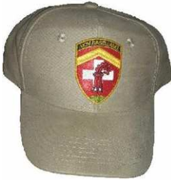
Tschapper mit aufgenähtem UOV-Badge: CHF 20.--

Es hat eine Weile gedauert, doch nun kann man endlich die ersten Merchandising Artikel des UOV BL käuflich erwerben: